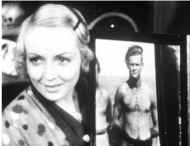
Juliette (Dita Parlo)

Si dans les années trente, elle tourne, en Suisse, avec Kirsanoff ( Rapt , 1934), en France avec Pabst ( Mademoiselle Docteur , 1937) et Renoir (le seul rôle féminin de La Grande Illusion , 1937), son