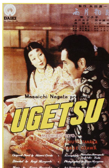
Conte de la lune vague après la pluie , Kenji Mizugochi

Ce genre de film est très codifié, le spectateur attend de voir un samourai, ou un ronin (des samourais errants, sans maîtres) qui respecte le code du Bushido (la voie de l'honneur) et utilise le sabre.